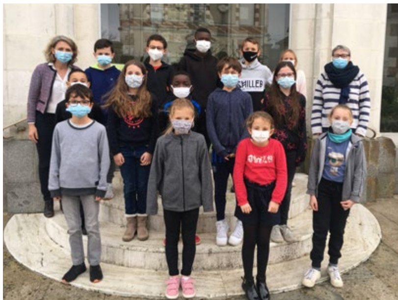
/ Le CME a dévoilé les projets qu'il souhaite mettre en place.

Les trois projets doivent désormais être étudiés pour en évaluer le coût et la faisabilité d'ici la fin de l'année scolaire.