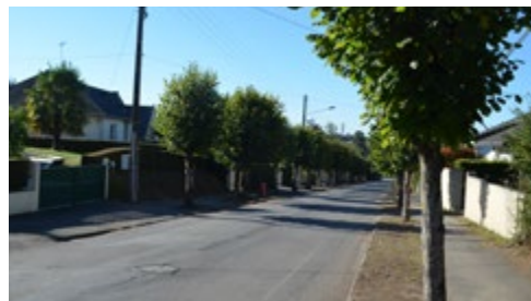
/ Le boulevard Jules Jouin avant et après travaux (ci-dessous).