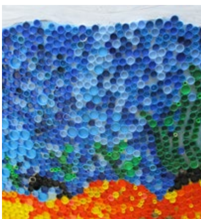
/ Le thème de l'eau a inspiré les différentes classes.

Cette année, le protocole sanitaire n'a pas permis à tous les parents de découvrir cette traditionnelle exposition sur l'art, installée dans le hall de l'école maternelle. Mais afin d'en faire profiter le plus grand nombre, celle-ci a été déplacée dans la verrière de la mairie, pendant 3 semaines en avril.