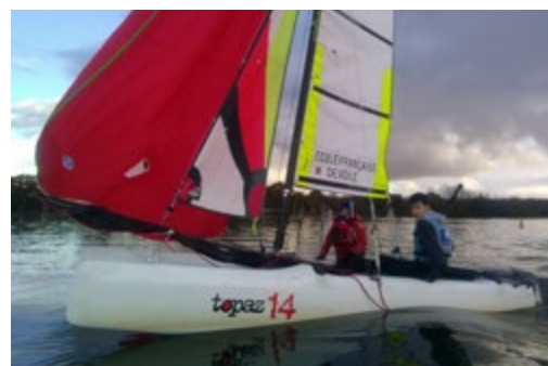
/ Au sein du Club nautique, des activités sont possibles pour tous les âges.

Et durant l'été, différentes animations seront au programme : des matinées sur l'eau, pour pratiquer la voile et la glisse avec un encadrement, la location de matériel (dériveur, catamaran, planche à voile...) ou encore des randonnées en paddle sur la Vilaine.