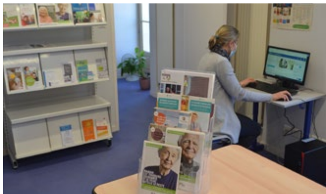
/ Au CCAS, les usagers peuvent bénéficier de différents outils et services.

Comme annoncé dans le précédent Tribain, le CCAS a changé de dimension. A contrario des rumeurs qui ont circulé ici ou là, ce service ne disparaît pas. Bien au contraire.