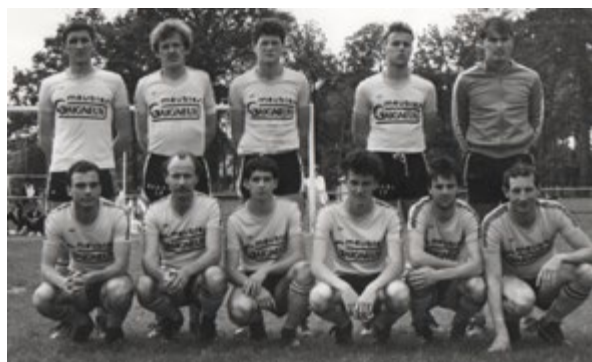
/ L'équipe de 1988 © Bernard Brunel.