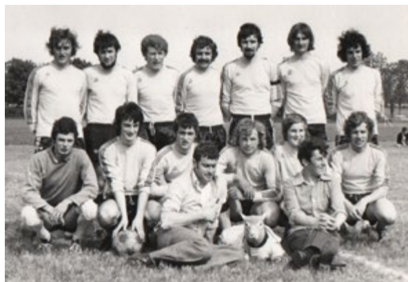
/ L'équipe de 1975 © Bernard Brunel.