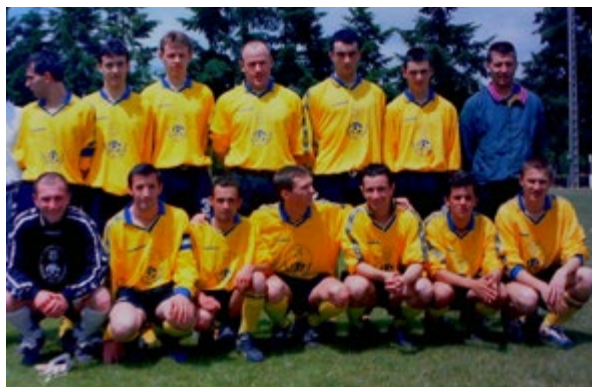
/ L'équipe de 2000 © Bernard Brunel.