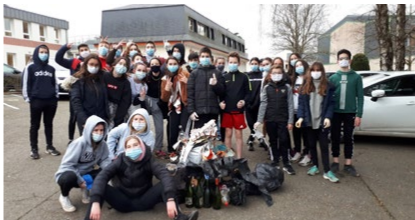
/ Les élèves du collège St Joseph ont participé à plusieurs randonnées sportives et écologiques.