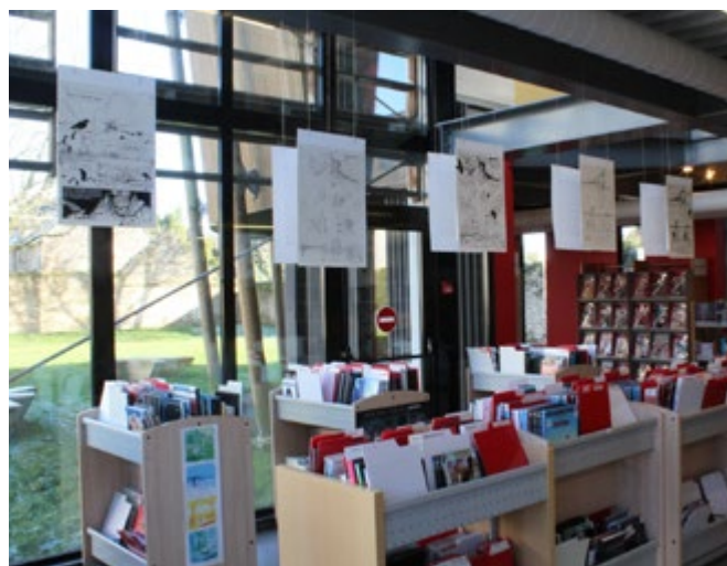
/ Plusieurs planches de dessins réalisées par les auteurs du fanzine ont été exposées dans la médiathèque.

Grâce au talent de tous ces auteurs et illustrateurs, notre ville se trouve joliment mise en scène. Le document peut être consulté sur le site internet de la Ville et à la médiathèque.