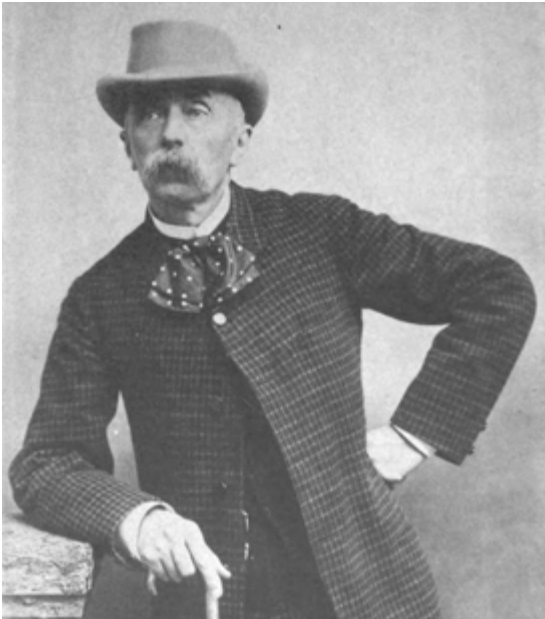
/ Adolphe Orain s'était vu remettre la Légion d'honneur en 1886.

À Bain-de-Bretagne, une avenue porte le nom d'Adolphe Orain. Cet enfant de la commune est né le 19 avril 1834.