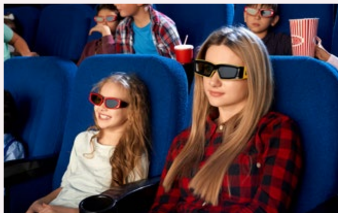
/ La liste des activités concernées par le Pass culture et sport est en cours d'élaboration.

D'un point de vue pratique, le dossier sera à télécharger depuis le site de la Mairie ou à récupérer auprès du CCAS et devra ensuite être déposé au CCAS.