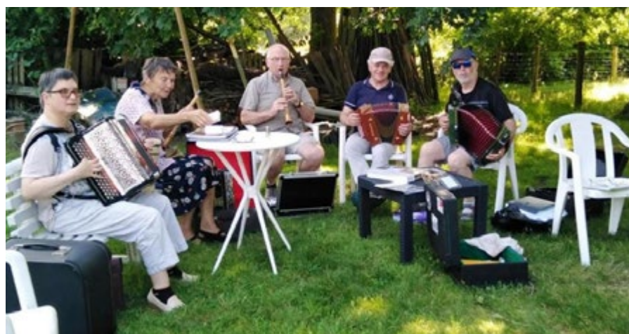
/ Musique, chant, danse... la bonne humeur est de mise avec Bain de cultures.