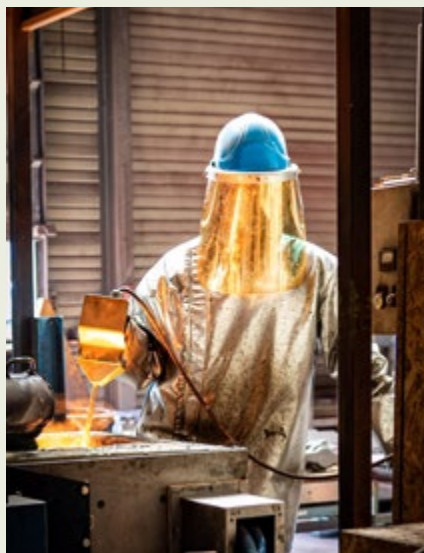
/ La société sait valoriser ses atouts pour continuer de croître.

qui formait les fondeurs a fermé il y a quelques années. La motivation des candidats et la formation sur le terrain sont donc essentielles.