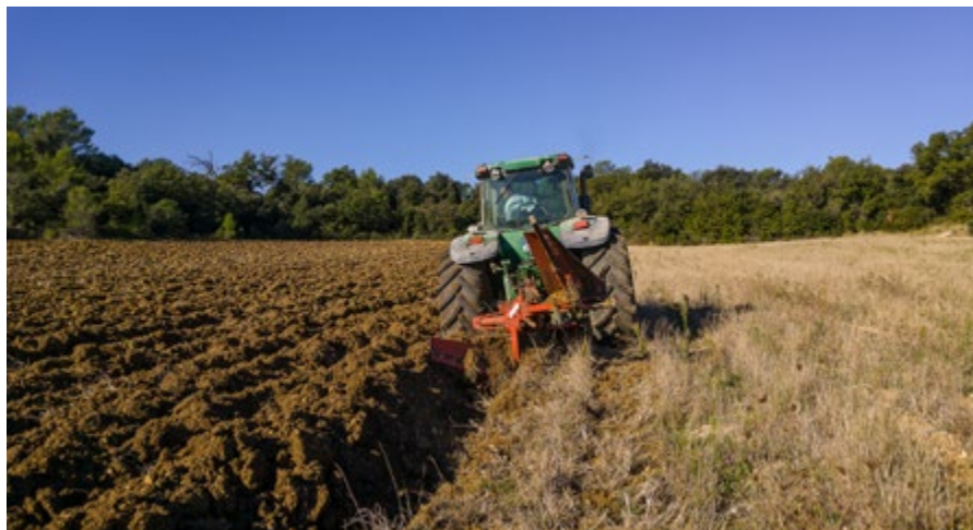
/ L'activité agricole demeure essentielle.

80 % de la commune est situé en zone rurale. C'est un secteur propice aux balades et aux jolis paysages. Mais c'est aussi un lieu d'activités agricoles, indispensables pour nous nourrir.