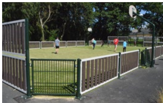
/ Le city-stade est accessible en journée sur un temps limité.

Pour les usagers, le respect de ces horaires est indispensable afin de préserver la tranquillité des habitants, situés à proximité. Il est demandé également à chacun de veiller à la propreté des abords du city-stade. Les déchets doivent notamment être déposés dans les poubelles qui sont à disposition. Malheureusement, ce n'est pas toujours le cas et des déchets se retrouvent ainsi trop souvent laissés dans la nature.