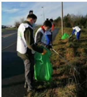
/ L'IME poursuit son action de ramassage de déchets.

La Mairie tient à remercier toutes les personnes qui ont pris part à ces initiatives. Ces actions doivent sensibiliser chacun d'entre nous sur la nécessité de bien gérer nos déchets.