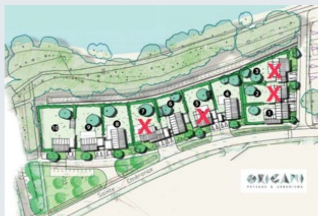
/ Le plan du lotissement avec l'indication des lots déjà attribués (sous réserve de modifications intervenues récemment).

Ou consultez le site www.baindebretagne.fr .