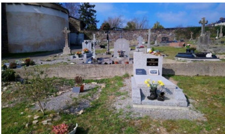
/ Le collectif s'emploie afin d'essayer d'installer des monuments funéraires sur les tombes des personnes défuntées qu'il accompagne.

Pour permettre à des personnes isolées et/ou aux ressources insuffisantes de disposer de sépultures décentes, une réflexion sur la réutilisation de monuments funéraires, installés sur des concessions échues, a été menée