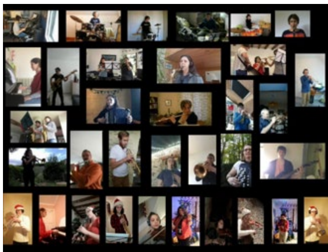
/ Certaines activités d'Opus 17 se font depuis plusieurs mois à distance.

L'école de musique développe depuis de nombreuses années le goût de la musique auprès des habitants du territoire.